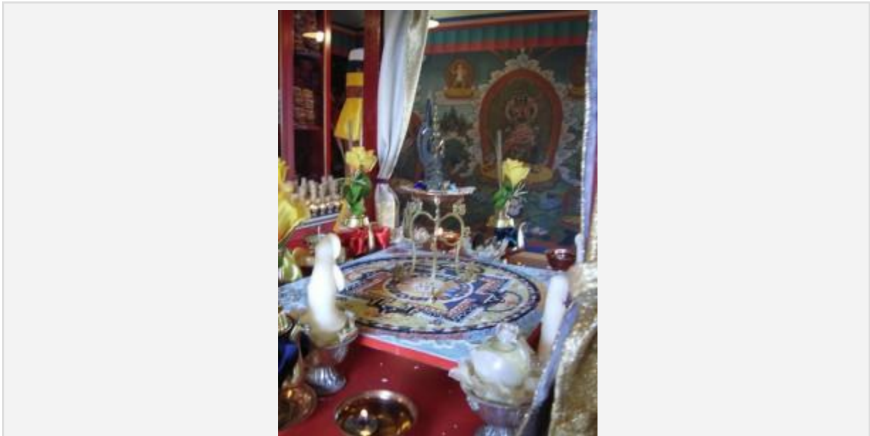
Mandala de sable réalisé durant la pratique d'Amour et de Compassion durant la pratique de « jeûne alterné » de 16 jours.

Ces deux contemplations simultanées est l'expérience de l' union du samsara et du nirvana . Pour de tels maîtres réalisés, nirvana et samsara sont mêlés tout comme le lait mélangé à l'eau .