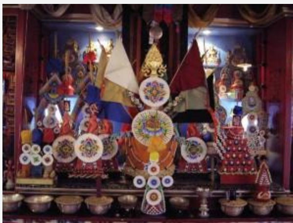
Autel pendant de longs rituels de Mahakala (protecteur de sagesse)