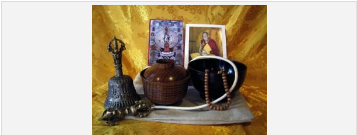
Photo prise lors d'une pratique de « jeûne alterné » de 16 jours durant la retraite de 3 ans.

Remarque importante : dans cet article je vous communique des liens. Ils peuvent pointer vers des pages en cour de préparation. Je les ai cependant mis ici pour vous permettre d'accéder aux articles lorsqu'ils seront rédigés. C'est à l'écriture de cet article que me sont venues de nombreuses idées d'articles. Merci à Cédric de m'avoir sollicité pour cet article, je peux donc initier toute une série d'articles à venir. Pardonnez-moi de vous faire tomber sur des pages peut être encore vides le jour où vous lirez cet article, j'ai songé utile de vous donner ces liens quand même. Lors de l'édition du second article en octobre, tous ces articles auront été publiés.